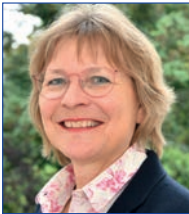
Imke v. Bornstaedt-Küpper Bundesvorsitzende

Die Bundesleitung, der Bundesvorstand und die Bundesgeschäftsstelle stehen Ihnen gerne zur Verfügung!