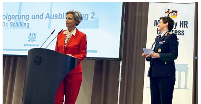
Abteilungsleiterin Personal im Bundesministerium der Verteidigung: Ministerialdirektorin Oda Döring am Redepult