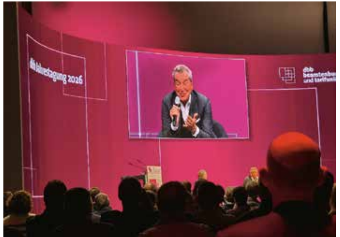
Publizist Michel Friedman

Der Tag begann mit einem Vortrag von Prof. Dr. Dr. Friedman (Jurist, Publizist und Philosoph). Eine bewusst provokante Einstiegsfrage sorgte sofort für Aufmerksamkeit. Der eindrucksvolle und bewegende Vortrag endete verdient mit Standing Ovations. Im anschließenden Interview positionierte er sich klar zur Verfassung, zu politischen Parteien und zum gesellschaftlichen Miteinander.