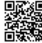
2. Bericht vom dbb zum Europäi- schen Abend

Einfach QR-Code scannen und direkt informieren.