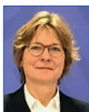
Imke von Bornstaedt-Küpper stv. Bundesvorsitzende